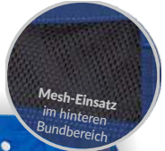
Mesh-Einsatz im hinteren Bundbereich

in vielen Farben erhältlich passend für Ihren Betrieb