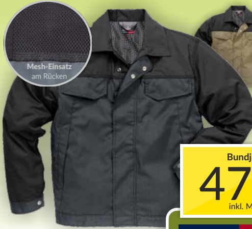
Mesh-Einsatz am Rücken