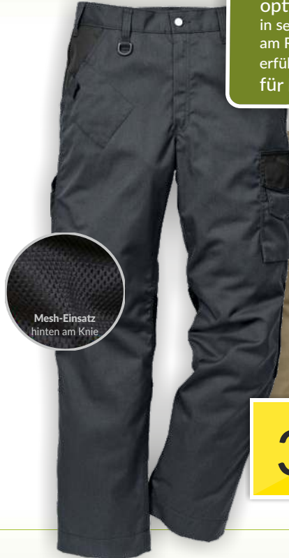
Mesh-Einsatz hinten am Knie

optimale Ventilation durch luftdurchlässiges Mesh-Material in sensiblen Bereichen wie Schulter, Nacken, unter den Armen, am Rücken und in den Kniebeugen erfüllt höchste Ansprüche an Passform, Funktionalität und Komfort für hohe industrielle Anforderungen geeignet